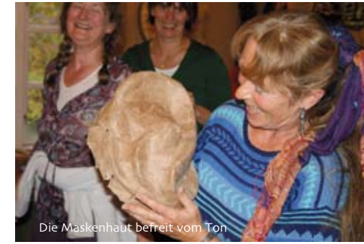
Die Maskenhaut befreit vom Ton