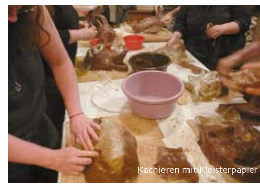
Kachieren mit Kleisterpapier