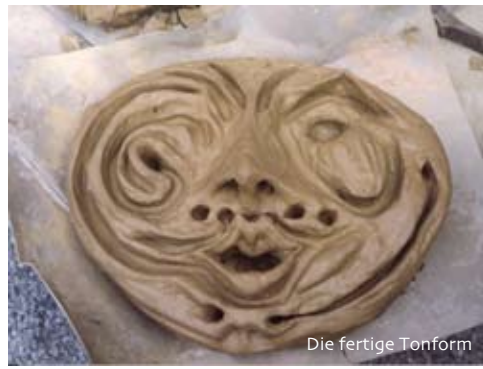
Die fertige Tonform