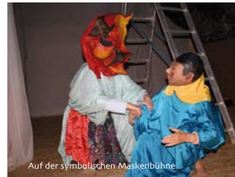
Auf der symbolischen Maskenbühne